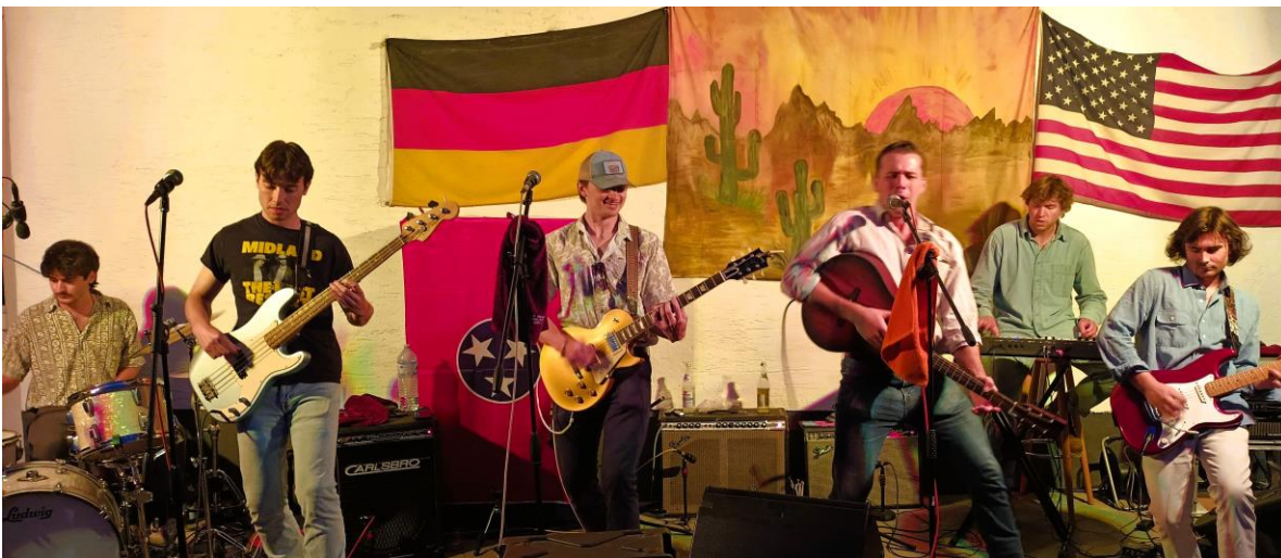
Wasted Major aus Nashville im Juni 2023 beim „open air“ in Großkötz

Am Samstag, 16. November 2024 gibt es dann ein Wiederhören und Wiedersehen mit den Musikern der Band WASTED MAJOR aus Nashville. Nach ihren tollen und begeisterten Auftritten im Juni vergangenen Jahres in Kötz und Birkenried, sind die sechs Musiker dieses Mal im November unterwegs. Sie freuen sich sehr auf ihr Gastspiel bei den CWF Kötz, dieses Mal im Landgasthof Jehle in Limbach . Reservierungen werden gerne schon entgegengenommen unter Email: cwf-koetz@t-online.de