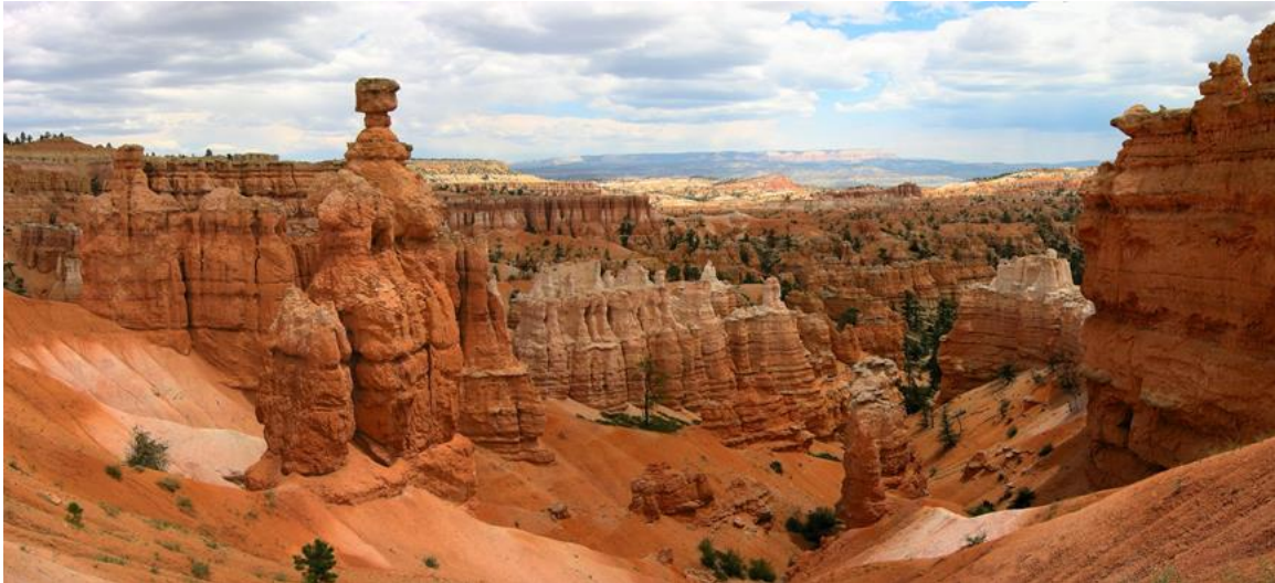
Bryce Canyon National Park.