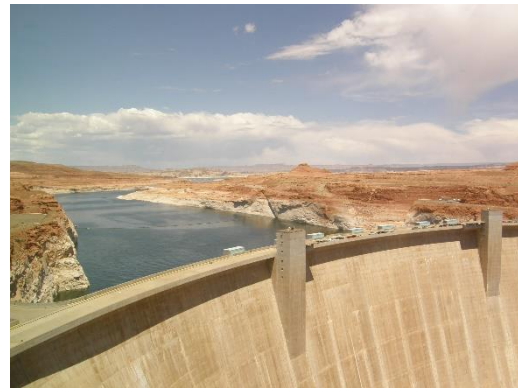
Glen Canyon Damm