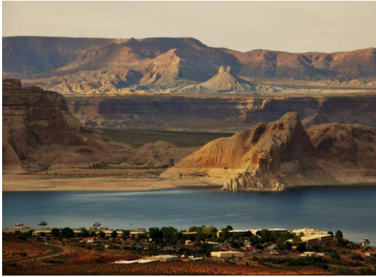
Page und Lake Powell