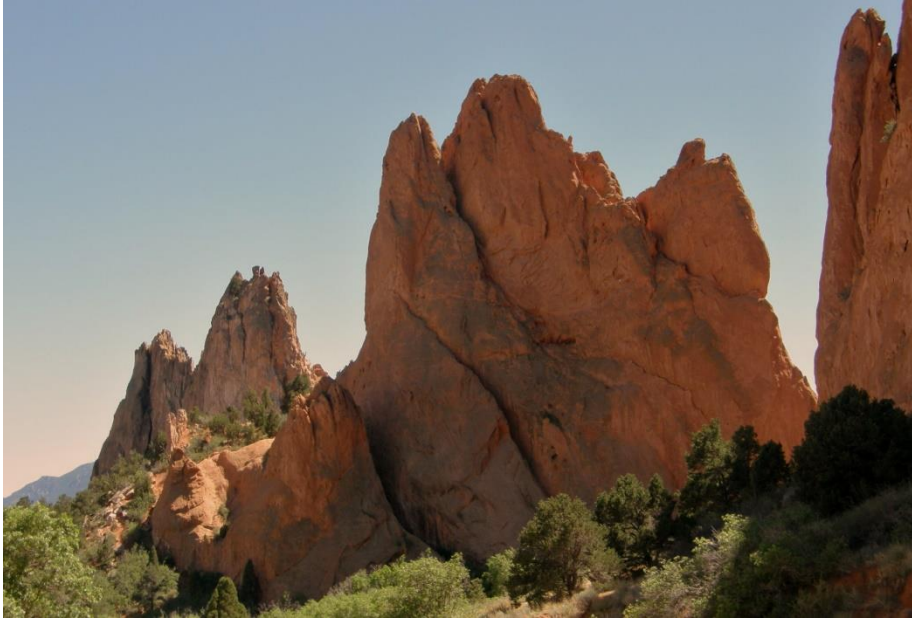
Garden of the Gods

Unsere erste Etappe geht in südlicher Richtung nach Colorado Springs. Dort sehen wir den „Garden of the Gods“ mit seinen bizarren Felsformationen. Ute Indianer führten im 16. Jahrhundert die spanischen Entdecker durch diese ungewöhnliche Naturlandschaft.