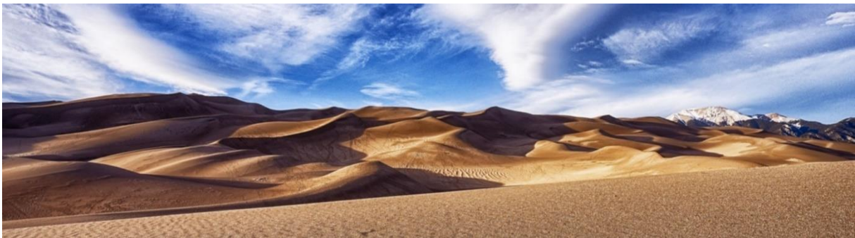
"Dieses Foto" von Unbekannter Autor ist lizenziert gemäß CC BY-SA

Unsere gut dreistündige Fahrt heute Morgen führt uns durch den Cimarron National Forest zum beliebten Sand Dunes National Park, einer imposanten Dünenlandschaft.